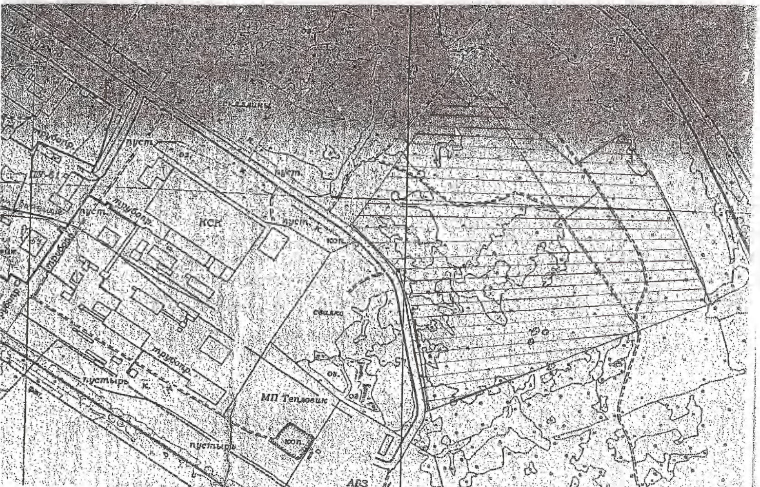
СХЕМА РАЗМЕЩЕНИЯ ЗЕМЕЛЬНОГО УЧАСТКА по адресу: Пермский край, г. Нытва, микрорайон Солнечный для организации спортивной площадки (страйкбол)