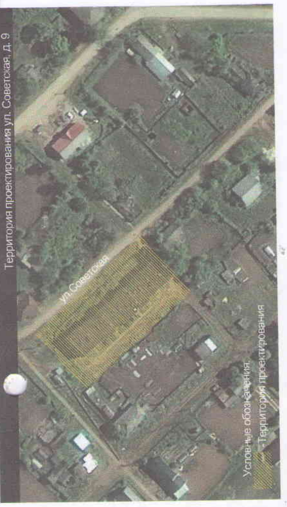
Территория проектирования ул. Советская, д. 9