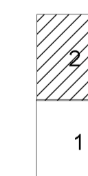
Схема расположения планшетов