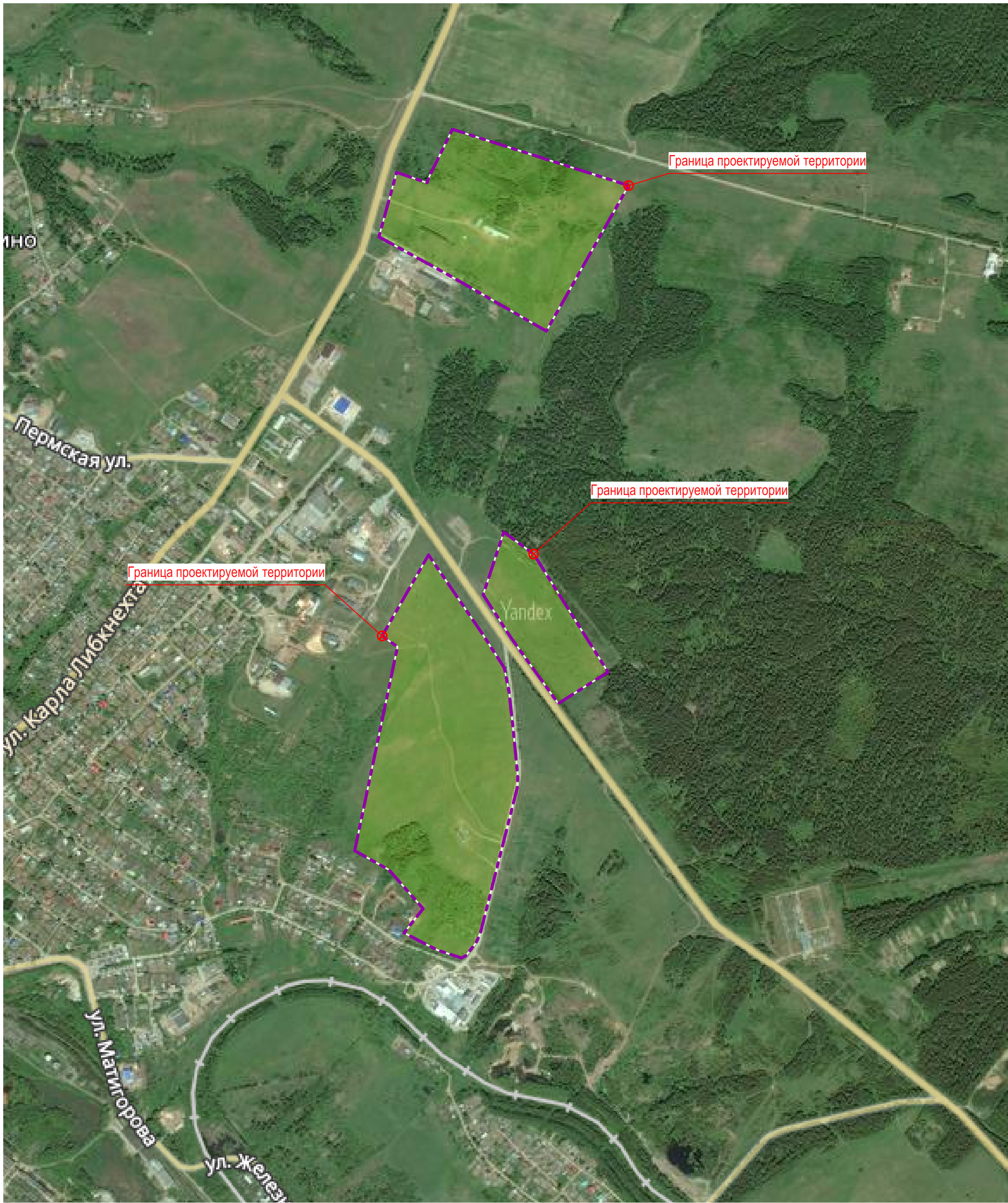
Схема расположения элемента планировочной структуры. (Утверждаемая часть)

"Проект планировки территории включая в себя кадастровые кварталы: 59:26:0610504, 59:26:0610713, 59:26:0610714, 59:26:0610715, 59:26:0610717, 59:26:0610718, 59:26:0610720 и проект межевания территории кадастрового квартала 59:26:0610504 в г. Нытва"