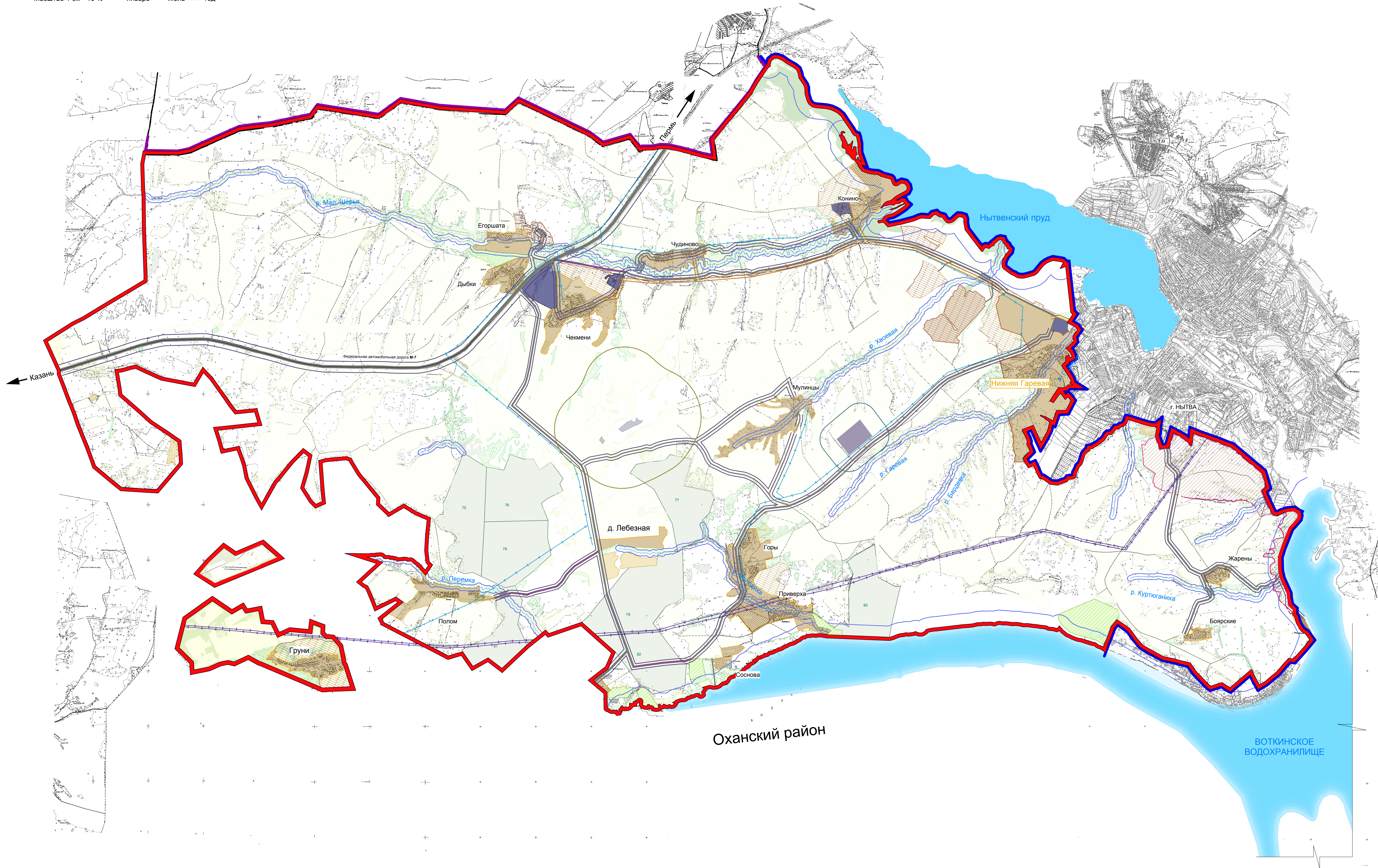
Схема санитарно-защитных зон и ограничений